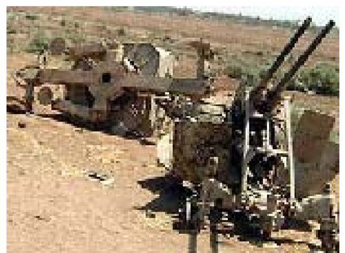
بقايا اسلحة مدمرة

ليس من حق المهزوم ان يصرح وان يتحدث». هذا ما كان يرددته طوال عدة اشهر، اللواء الركن في الجيش العراقي (...)، والذي كان يحتل مركز (قائد صف) - وهو مركز قيادي لا يوجد منه سوى القليل جدا في القوات المسلحة. ويفترض ان تكون الوحدات العاملة تحت امرته في كل قطعات الجيش. وفي كل أنحاء البلاد. وبعد الإحاطة وتعهد بعدم ذكر اسمه، او نشر صورته له، علق قائلا: ماذا يمكن ان يحدث تحت الصورة.. (القائد المهزوم) ومع كل ذلك، ومع كل ويلات الحرب، ما زال صدام يصبر على انه (انتصر). وهو في نظره كذلك فعلا، لأنه لم يقل لحد الآن: تحدث اللواء الركن عن طريفة الحرب الاميركية، قائلا: كان القرار الاميركي باقتحام بغداد من اكثر القرارات العسكرية جراءة وخطورة. ولو لم تكن القوات الاميركية قد اجهزت على (درع الصويرة)، لما كنا لنحقق ذلك الاقتحام الذي يقضي مثبثا للاستغراب !! لقد بقيت القوة المهاجمة من جهة الغرب في الوصول الى المطار، وتكبدت خسائر جسيمة، لاننا كنا نعلم بانها ستقدم من الاتجاه الغربي،