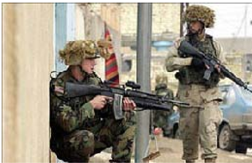
قوات التحالف اعلنت انسحابها الى قواعد خارج المدن. مشهد يومي في مدن العراق

وازدادت خطة اميركية لتسليم السيادة الى العراقيين يوم ٣٠ حزيران/يونيو تعقيداً بعد ان طالبت الغالبية الشيعية باجراء انتخابات قبل عملية التسليم بالاضافة الى خلافات على دستور مؤقت يوجه المجلس الذي سيتولى السلطة.