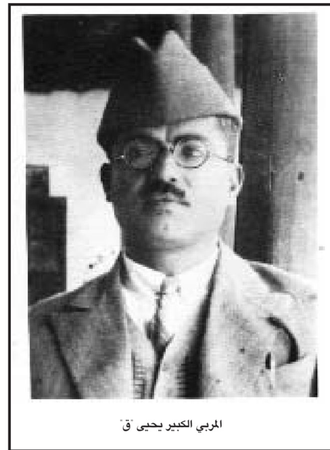
المربي الكبير يحيى ق